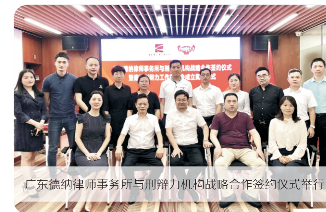
广东德纳律师事务所与刑辩力机构战略合作签约仪式举行