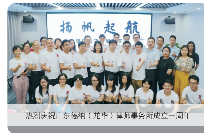
热烈庆祝广东德纳（龙华）律师事务所成立一周年