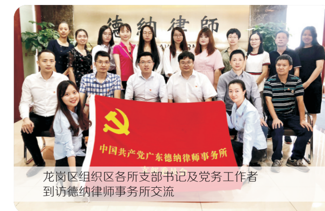
龙岗区组织区各支部书记及党务工作者到访德纳律师事务所交流