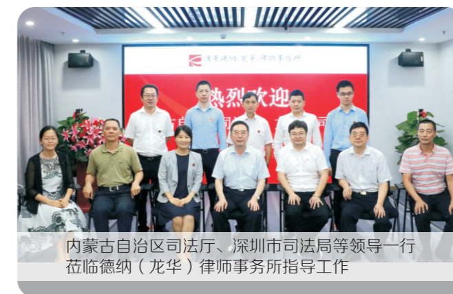
内蒙古自治区司法厅、深圳市司法局等领导一行莅临德纳（龙华）律师事务所指导工作

诚意 征稿 投稿邮箱： denalawcx@sohu.com 咨询电话： 0755-82805168