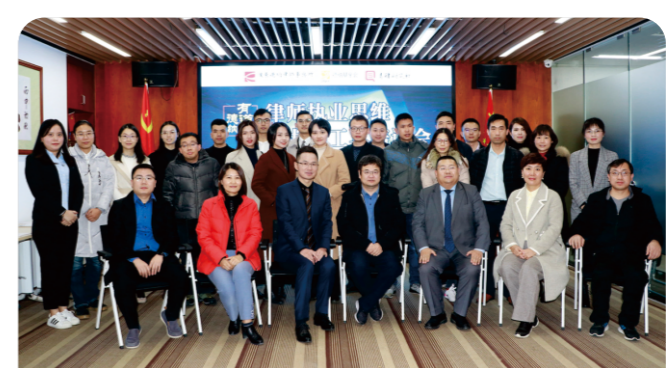
《德納有道：律師執業思維與辦案工具》培訓會成功舉辦