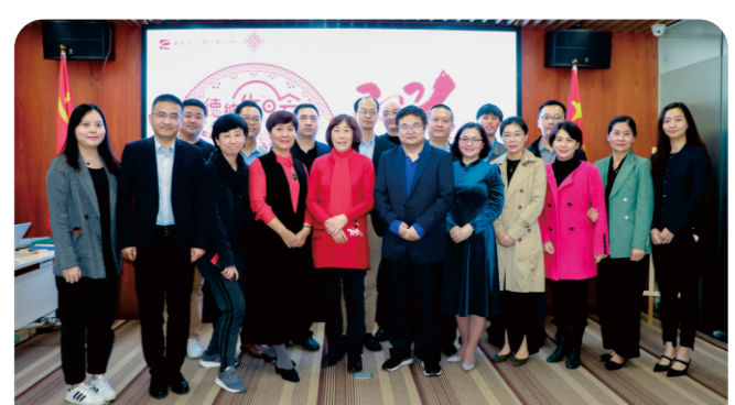
融匯拓新 合力共贏——德納律師2020年度表彰大會