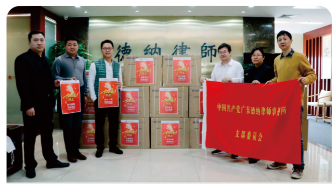
德納黨支部向河北捐贈10000個口罩