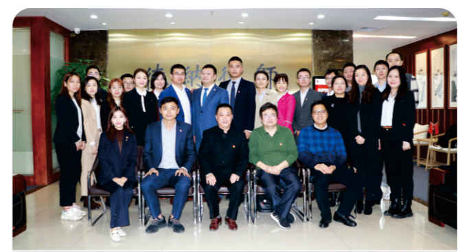
德納律師與多家律師事務所開展學習交流活動