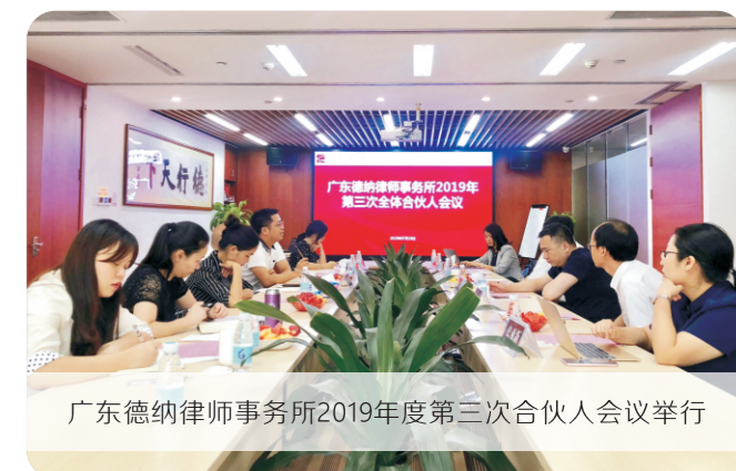
广东德纳律师事务所2019年度第三次合伙人会议举行