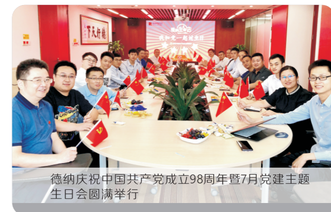
德纳庆祝中国共产党成立98周年暨7月党建主题生日会圆满举行