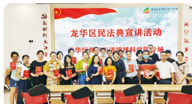
德纳（龙华）律所：《民法典》宣讲