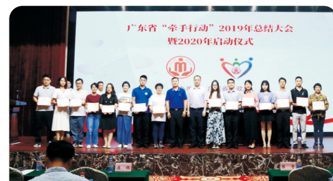
德纳持续关爱留守与困境儿童——积极参与广东省民政厅“牵手行动”