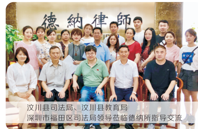
汶川县司法局、汶川县教育局、深圳市福田区司法局领导莅临德纳所指导交流