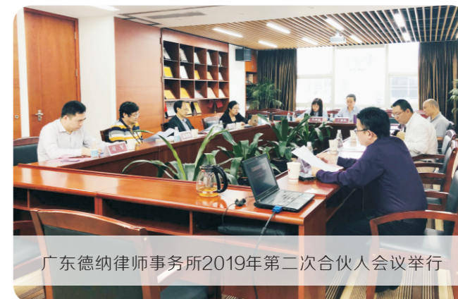
广东德纳律师事务所2019年第二次合伙人会议举行