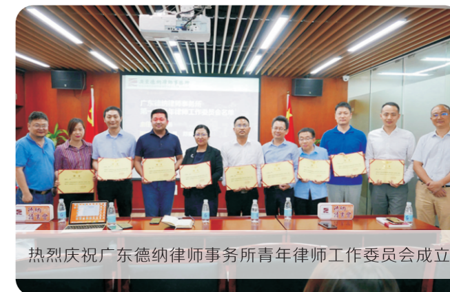
热烈庆祝广东德纳律师事务所青年律师工作委员会成立