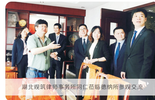
湖北观筑律师事务所同仁莅临德纳所参观交流